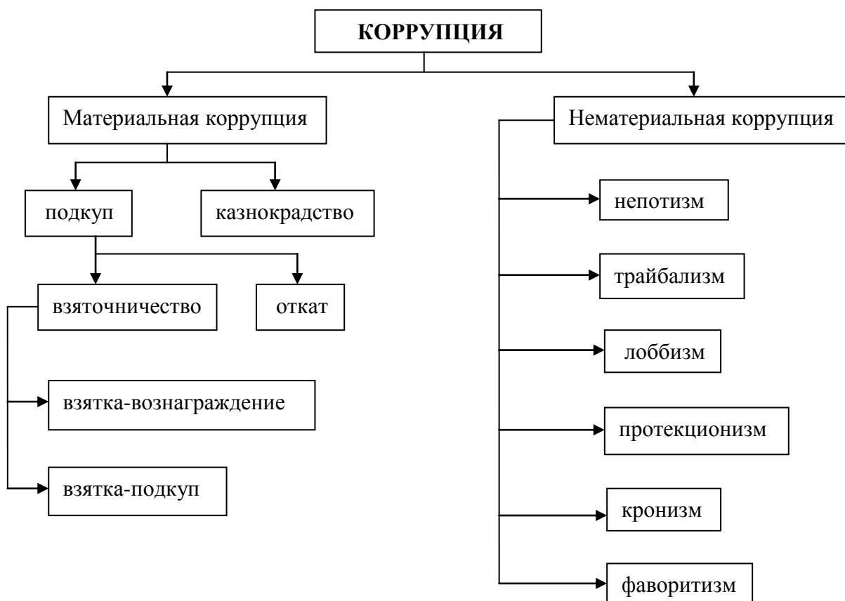
Схема 3. Классификация коррупции по предметному признаку

В зависимости от предмета можно сформировать следующую классификацию коррупционных проявлений (См. Схему 3).