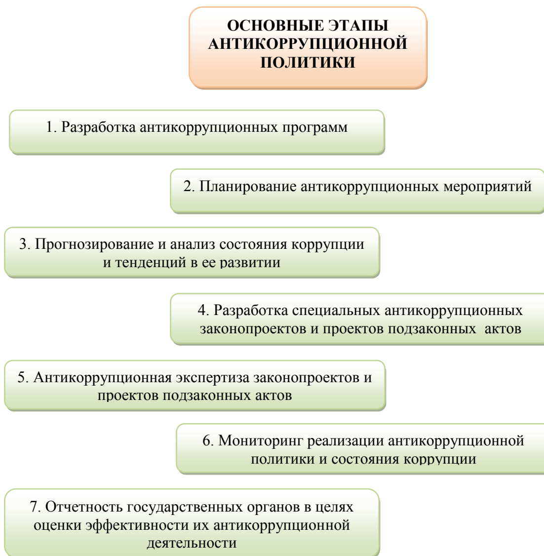
Схема 4. Основные этапы антикоррупционной политики

Разработка антикоррупционной политики начинается с уяснения ее основных направлений . Эти направления свойственны практически любому государству, даже такому, где уровень коррупции в данное время не является угрожающим. Другое дело – содержание конкретных мер, укладываемых в каждое из направлений (блоков). Тут универсализма быть не может. Больше того, содержание направлений антикоррупционной политики должно корректироваться не только по мере осуществления отдельных мер, но и с учетом результатов глубинных исследований коррупции, основанных на научном подходе. Классификация, построенная по данному критерию, является стержневой, поскольку позволяет оценить, насколько адекватно государство