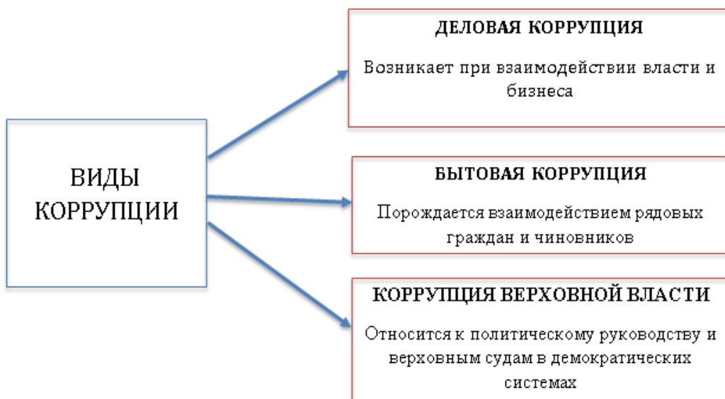
Схема 2. Виды коррупции

Широко известна классификация коррупции по цветовому признаку: черная, серая и белая . Черная коррупция осуждается всеми слоями общества, к серой нет однозначного отношения, а белая , в целом, воспринимается нейтрально. В зависимости от волеизъявления взяткодателя (добровольная дача взятки или вымогательство) различают принудительную и согласованную коррупцию. По степени общественной опасности (социальная вредность и социальные последствия) коррупционные проявления подразделяют на коррупционные проступки и коррупционные преступления .