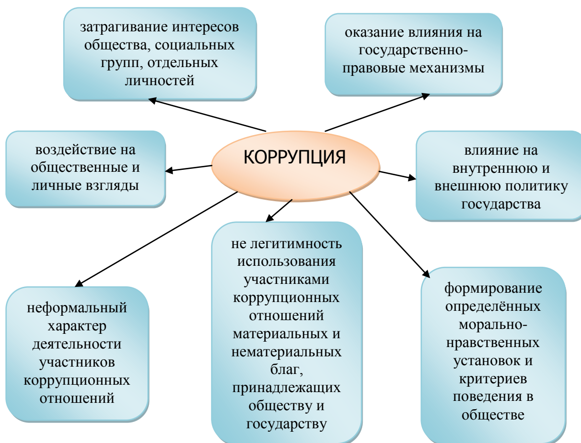
Схема 1. Качественные признаки коррупции

Учитывая особенности возникновения, развития коррупции можно утверждать, что она обладает рядом качественных признаков (См. Схему 1), позволяющих выделить её в самостоятельное явление. К таким признакам можно отнести: