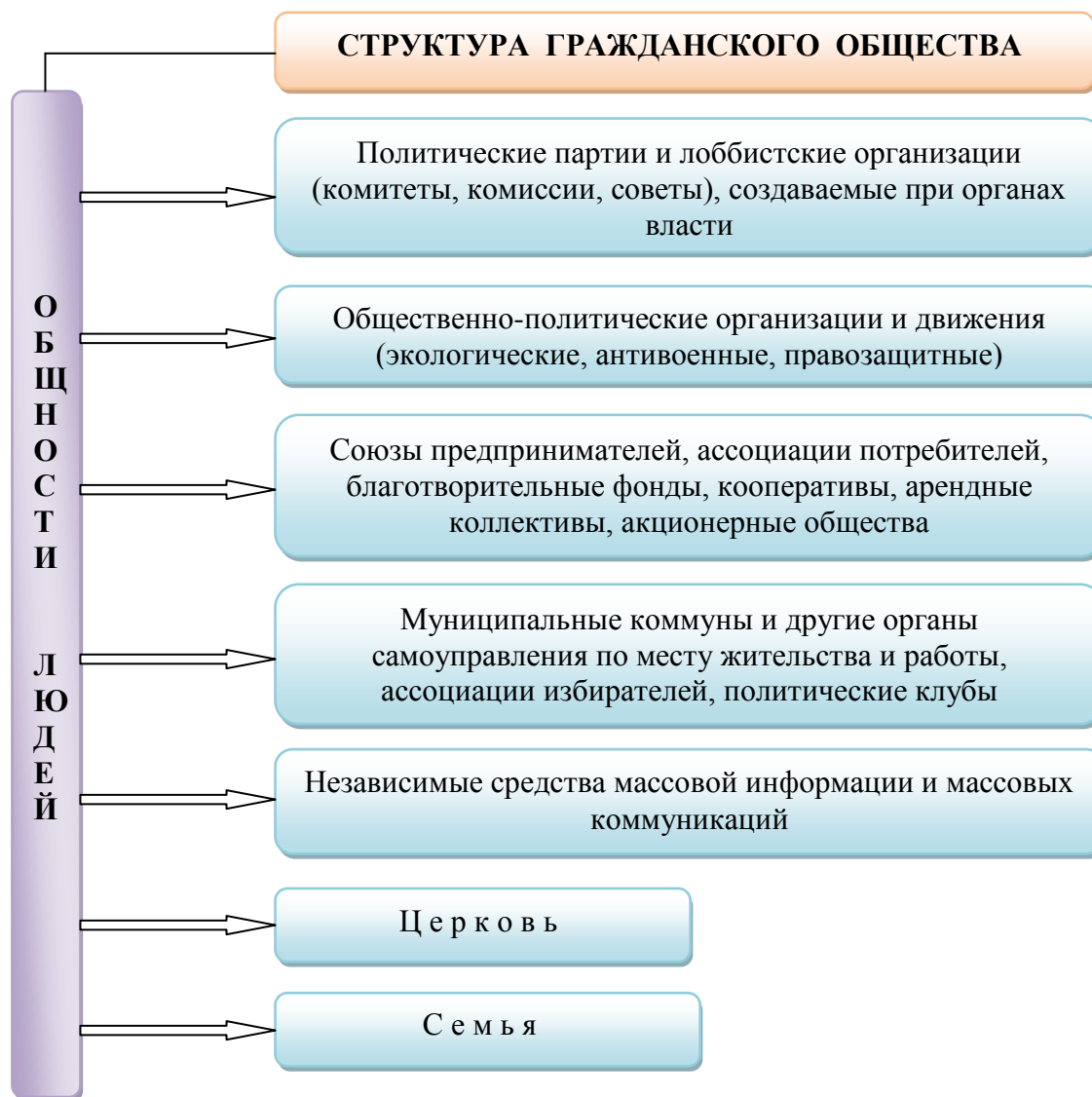
Схема 6. Структурные элементы гражданского общества

Отношения между компонентами общества носят негосударственный и неполитический характер, поскольку образуют пространство свободного проявления людей, защищенных от вмешательства государства и других сил (семейные связи, профессиональные, экономические, религиозные и иные отношения). Государство и гражданское общество – это взаимосвязанные структуры. Демократическое государство содействует созданию различных