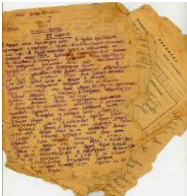
Личный дневник о войне