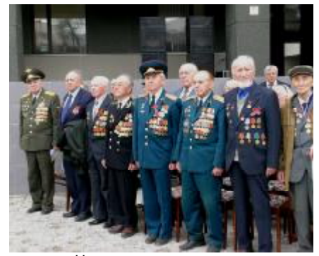
Наши дорогие ветераны