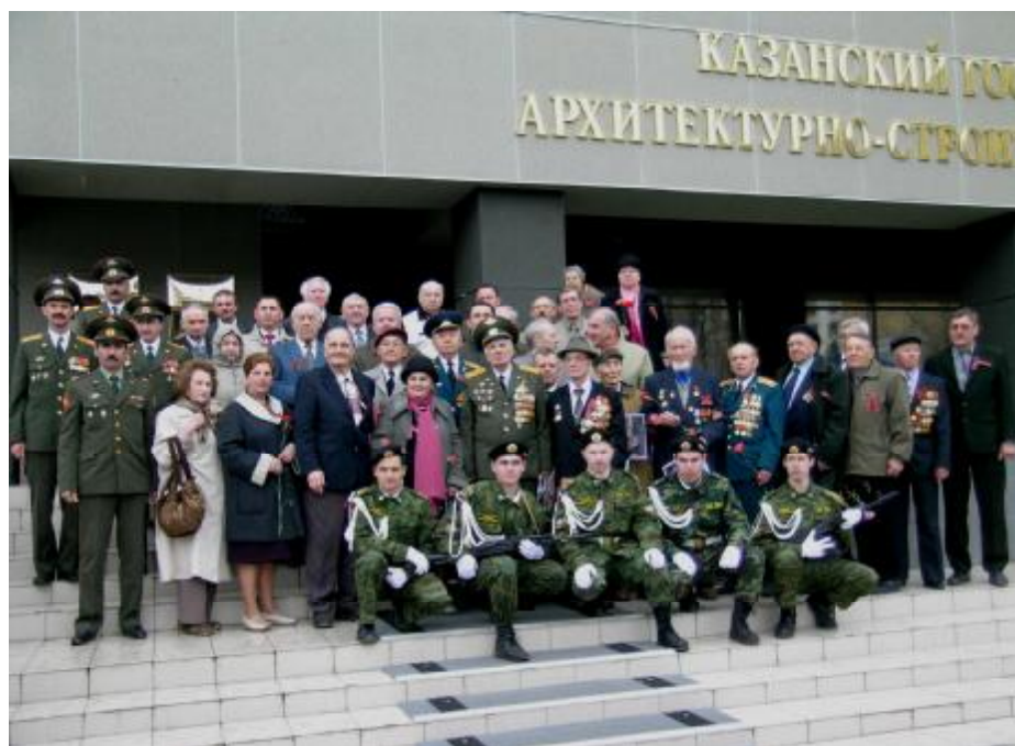
Праздник, посвященный Дню Победы. 8 мая 2007 г.

Низкий поклон всем, кто ценой больших лишений и жертв, ценой самоотверженного подвига на фронте и в тылу завоевал эту долгожданную, так необходимую нам всем Победу. Подвиг советского солдата и всего народа бессмертен!