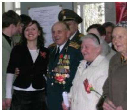
Седина на висках, в сердце – молодость