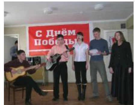
День Победы в студенческом городке.