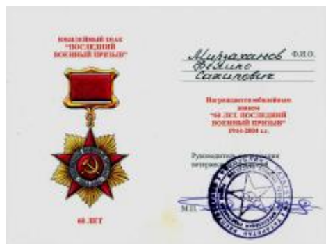
Юбилейный знак «60 лет. Последний военный призыв»

Награжден медалями «За Победу над Германией в Великой Отечественной войне 1941-1945 гг.», «За Победу над Японией», «Маршал Советского Союза Жуков».