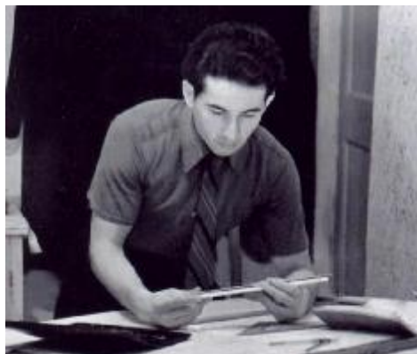
Работа над дипломным проектом, 1958 г.

После войны в 1953 году поступил в Казанский институт инженеров-строителей нефтяной промышленности (КИИСНП)*, успешно окончил в 1958 году уже Казанский инженерно-строительный институт (КИСИ).