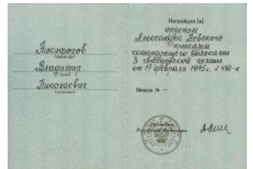
По материалам, предоставленным Ю.Н. Никифоровым, составила С. Канзафарова